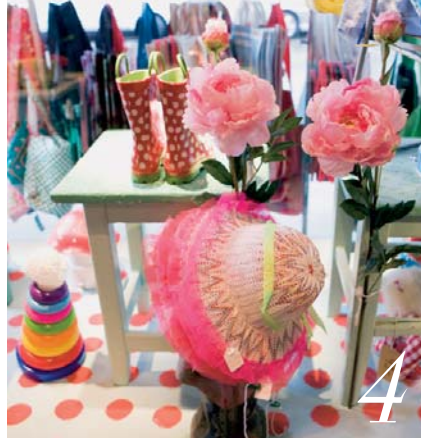
YAMATUTI «Ich verschenke am liebsten persönliche Sachen, die genau auf die Person zugeschnitten sind. In dieser verrückt-verspielten Boutique werde ich immer fündig.» Aarbergergasse 16/18, www.yamatuti.ch